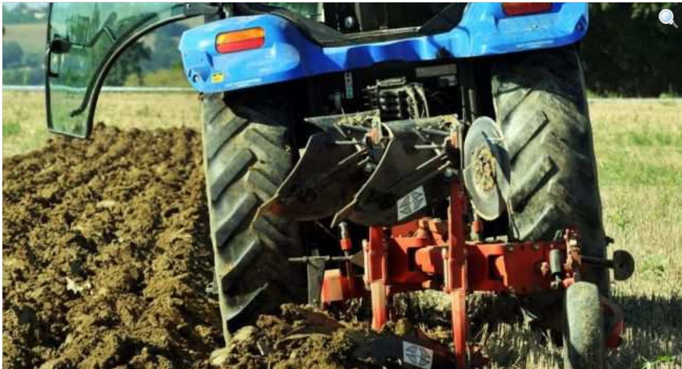
C'est l'époque des labours.